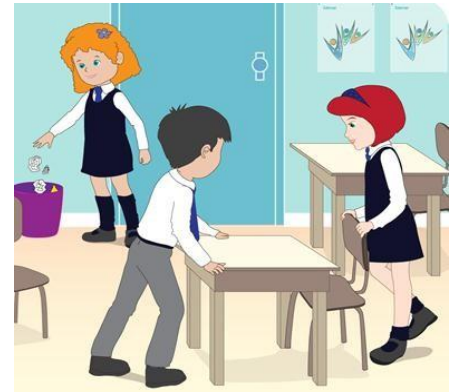
La sala de clase

3.- Escribe para que utilizamos los siguientes lugares públicos: