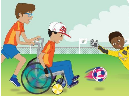
El patio de la escuela