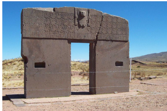
PUERTA DEL SOL, BOLIVIA TIWANAKU