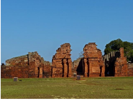
GUARANÍES, ARGENTINA MISIONES JESUITAS