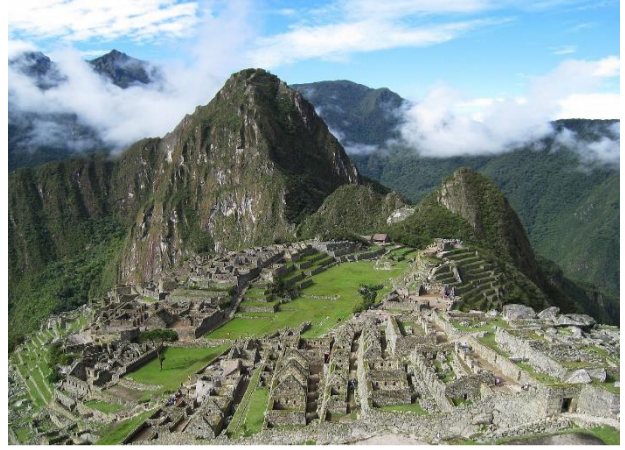
MACHU PICHU, PERÙ