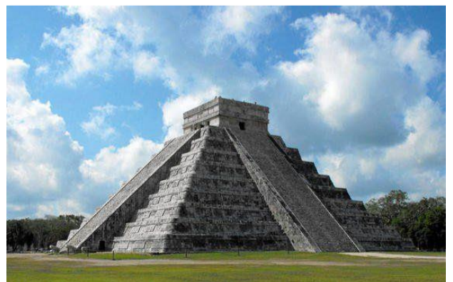
CHICHÉN ITZÁ, MÉXICO