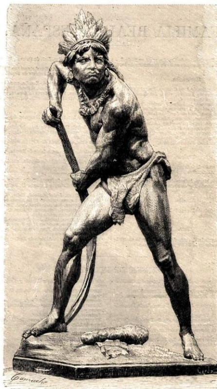
CAUPOLICÁN.—ESTATUA EN BRONCE, DEL ESCULTOR CHILEÑO D. NICANOR PLAZA.

II- Dibuja una de las principales obras del escultor chileno escogido en tu croquera o cuaderno.