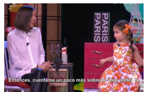
Luego conversa en italiano y en francés.