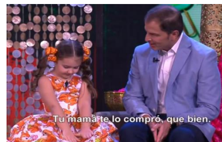
Y finalmente conversa en árabe .