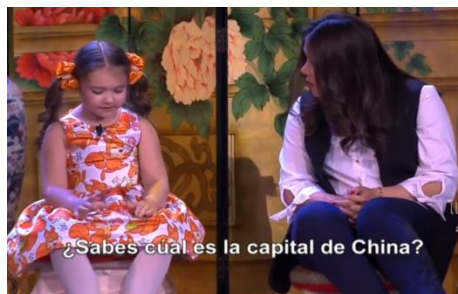
Después conversa en chino mandarín.