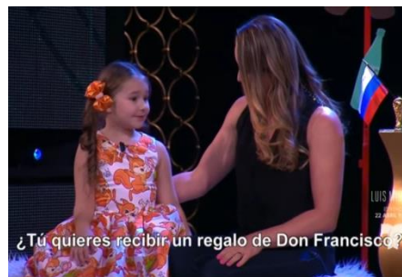
Primero conversa hablando su idioma ruso.