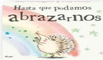
a.-Hasta que podamos abrazarnos

1.-Marca con una cruz X la portada del cuento.