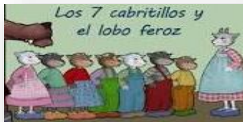
b.-Los siete cabritillos

2.-Marca con una cruz X qué dibujaron Tortuga y Erizo para que todo el mundo supiera que eran amigos.